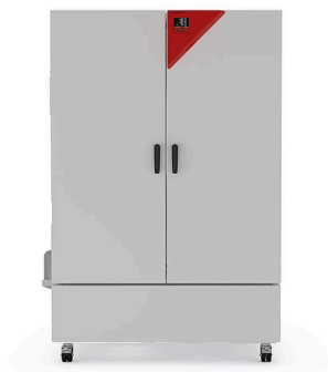
模型 KBF-S ECO 720