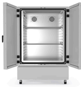
模型 KBF-S ECO 720